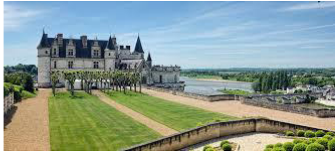
Le Château d'Amboise